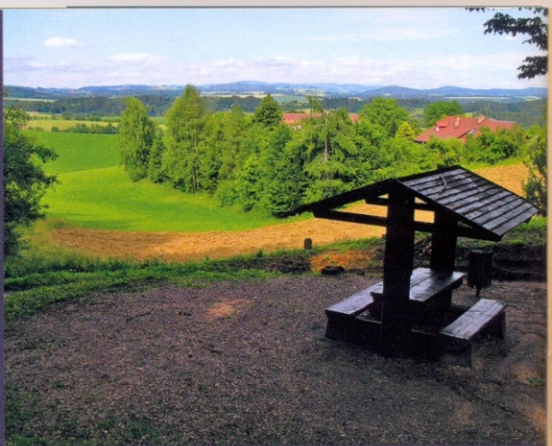
↑ Vyhlička na panorama Orlických hor