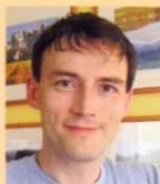
↑ Text a foto: Jan Pfoertner