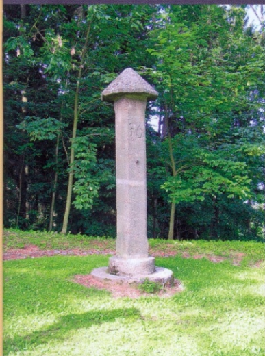
↓ Kamenný pranýř z roku 1693, stojící na úpatí kopce