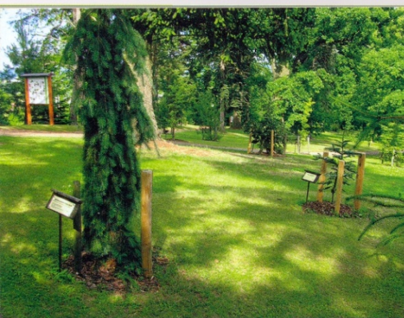
↑ Informační tabule v arboretu