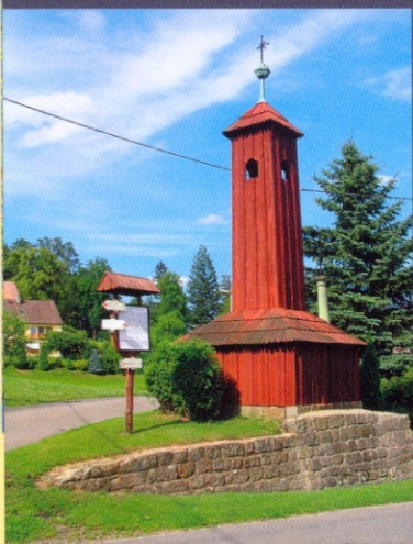
↓ Dřevěná zvonička z roku 1929 v centru obce

Torzo volně přístupného hradu stojí na výrazném zalesněném vrchu nad obcí ve výšce 546 m n. m. Vede k němu cesta zpočátku přímo odpočinková, pevná, dlážděná. U rozcestníku, kde odbočíme vlevo, však nastane změna – prudké stoupání na vrchol kopce s převýšením cca 100 m lze překonat jen díky traverzující lesní pěšině. Nahoře však pro vzrostlou vegetaci chybí