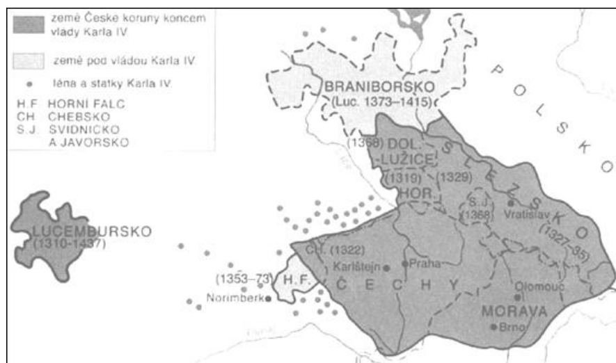
Český stát ve 14. století