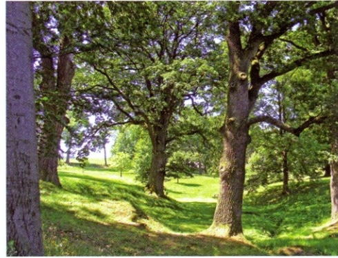
▲ Růže omejská a skupina dubů letních v parku.