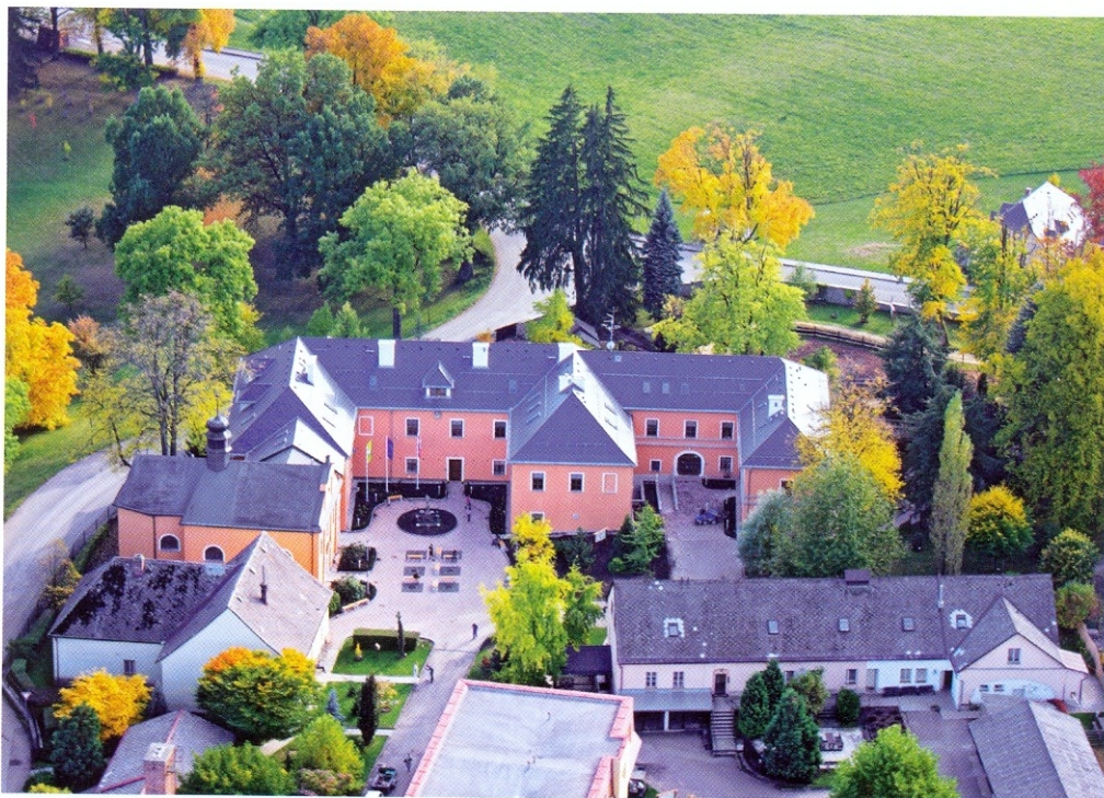
▲ Domov pod hradem Žampach v ptačí perspektivě.