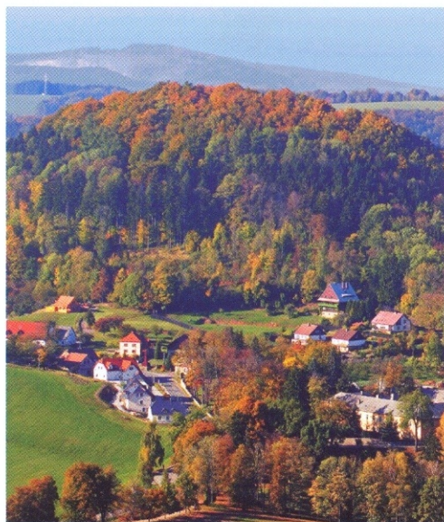
▲ Malebný pohled na výrazný kopec se zříceninou a obcí na jeho úpatí.